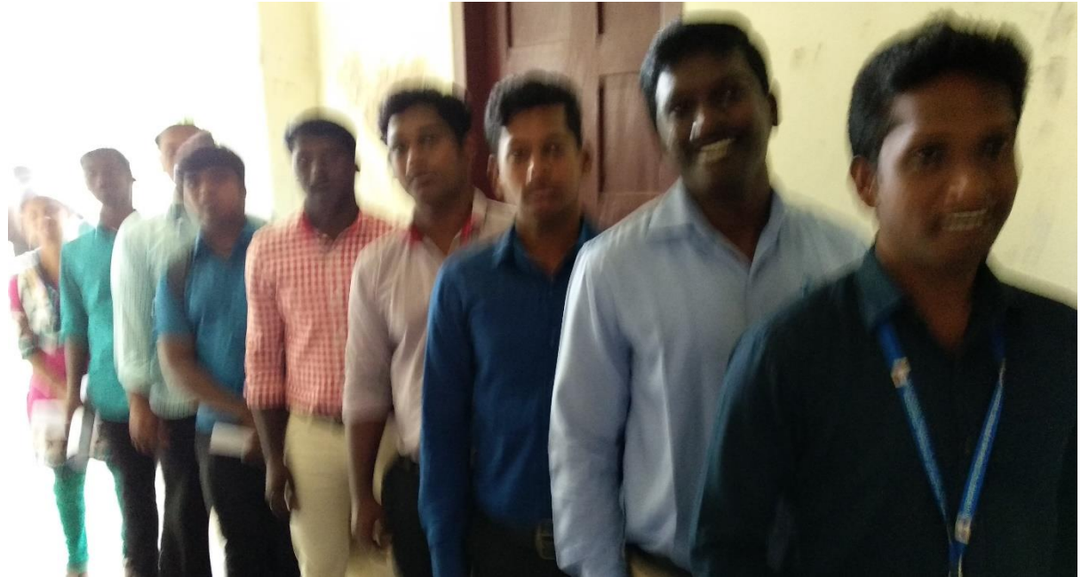
Feb 5 - WOW Series Workshop No.2