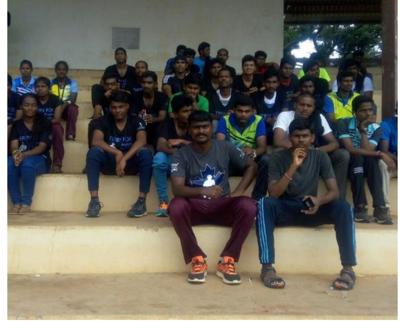
Sept 17 – Terry Fox Run Volunteers