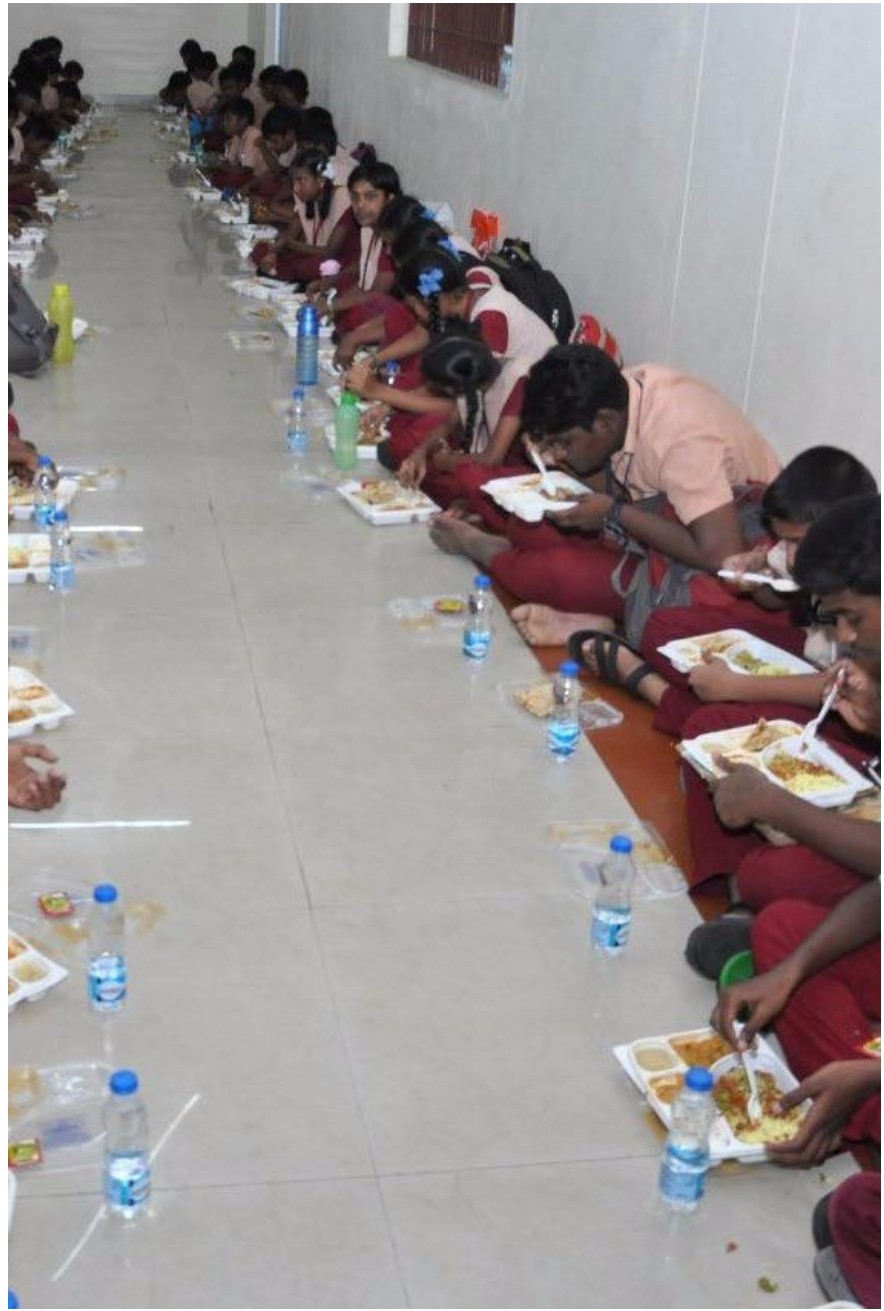
Nov 30 – Wings 2 Fly Semi Finals